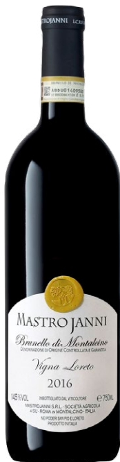
Mastrojanni Vigna Loreto Brunello di Montalcino 2018