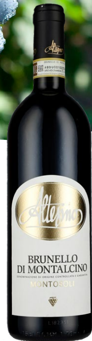
Altessimo Montosoli Brunello di Montalcino 2018

Syrlig og elegant næse. Yderst balanceret med violer, medicinske noter, sorte bær og et strejf vanilje. Lang afslutning. Floral, frisk, flot frugt og dybde. 95