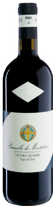
Barbi Vigna del Fiore Brunello di Montalcino 2018

Flot næse. Overbevisende flot vin og meget klassisk med masser af jordbærnoter. Yderst elegant og vellavet. Mørk, floral, masser af dybde og længde. 96